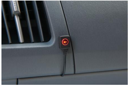
助手席のスイッチ