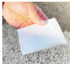
塗布スポンジに不織布またはティッシュペーパー(2枚)を巻きます。