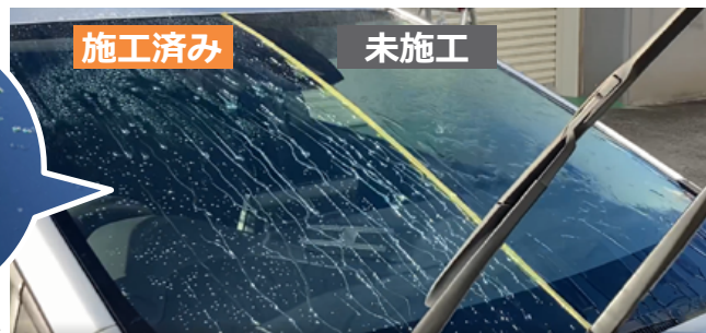
フロントガラスの左半分のみを撥水剤を施工した画像。放水すると施工済みガラスは、水滴となり、水をはじきますが、未施工ガラスは常に水が流れて視界を妨げています。