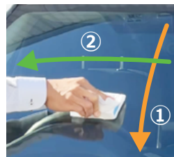
縦塗り後、横塗りの順番にガラス面に塗布します。