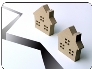
防災時の非常灯に