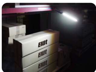
暗い場所を広範囲に照らす際に