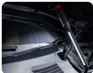
車の修理や点検に